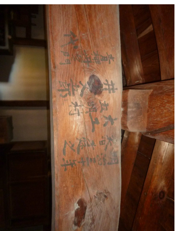
2階梁：上棟年記述あり