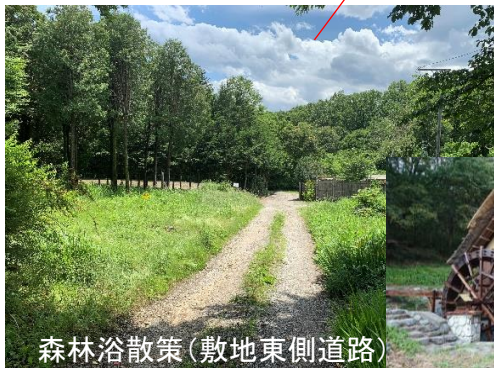
森林浴散策(敷地東側道路)