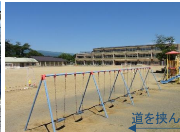
長坂小学校 (車で7分)