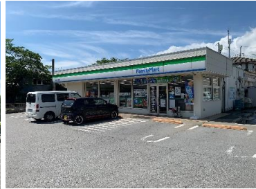
ファミリーマート (徒歩10分)