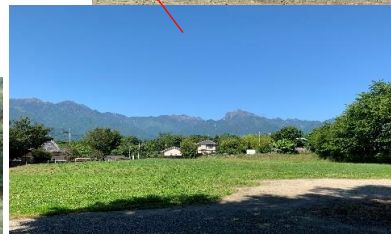
←敷地東側道路を下るとオオムラサキセンターの水車が見られます