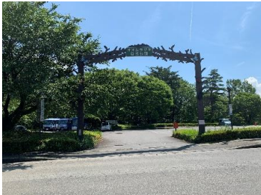
オオムラサキセンター (徒歩6分)