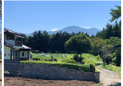
敷地東側に茅ヶ岳が望める