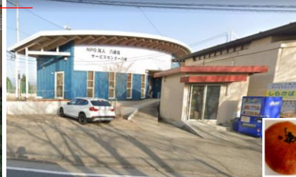
△パンやお弁当を販売→ (199m徒歩2分)