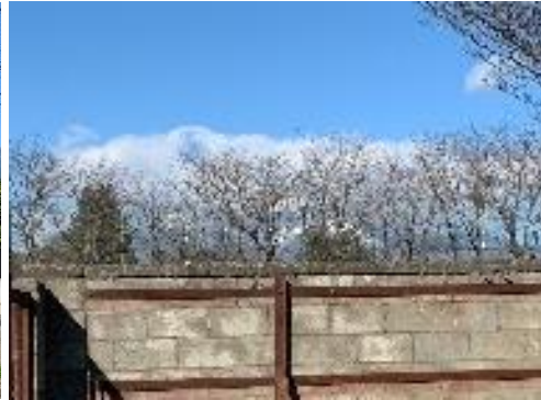
敷地北側に八ヶ岳連峰が望める