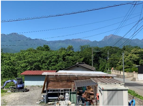
敷地西側に鳳凰三山が望める