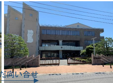
長坂中学校 (車で7分)