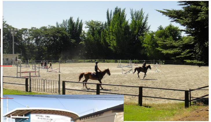
△週末には乗馬の練習が観賞できます